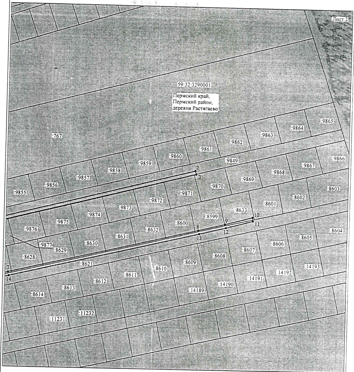
Схема расположения границ публичного сервитута объекта