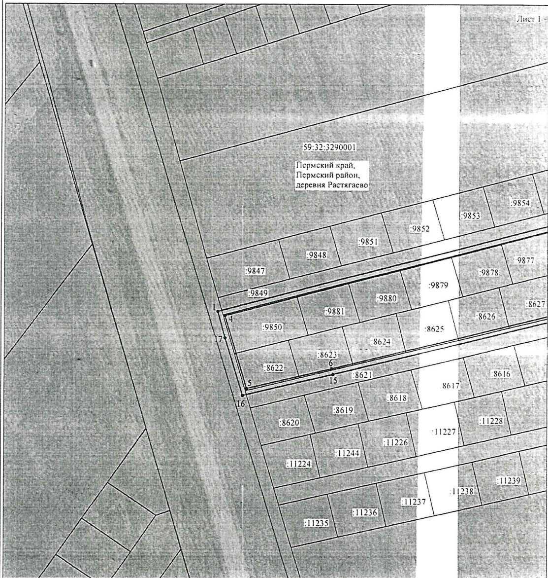
Схема расположения границ публичного сервитута объекта

Используемые условные знаки и обозначения: